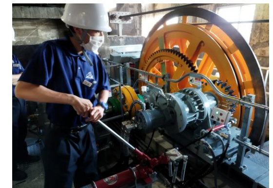
予備原動機による運転取扱訓練