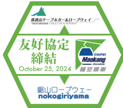
猫空ロープウェイ