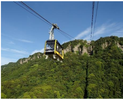
鋸山ロープウェイ

相互の旅客誘致を図ることを目的とし、ロープウェイ事業をはじめ、さまざまな分野において交流、連携を深め、両施設の情報発信、プロモーション活動を推進するため、2024年10月25日に友好協定を締結しました。