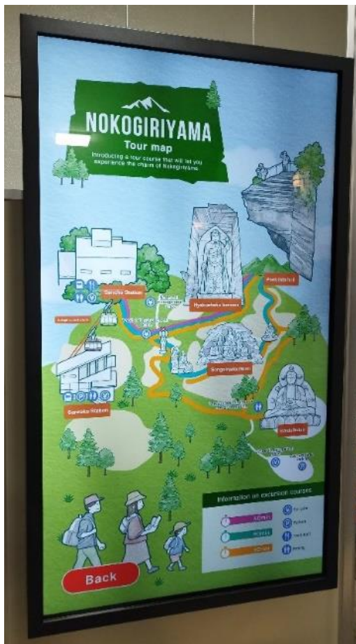
【タッチパネル式デジタルサイネージ】