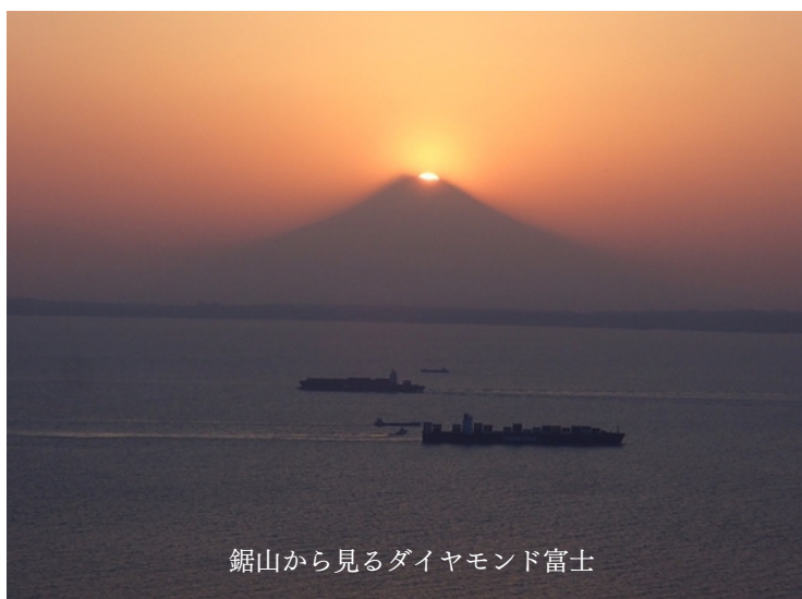
鋸山から見るダイヤモンド富士

富士山の山頂に太陽が重なる瞬間、ダイヤモンドのように輝く神秘的な現象のことで、日の入りの角度などから年に数回しか拝むことのできない貴重な光景です。鋸山からダイヤモンド富士を眺める今年の推奨日は2024年4月18日頃となっております。ぜひ、鋸山ロープウェー山頂駅展望台からご観覧ください。